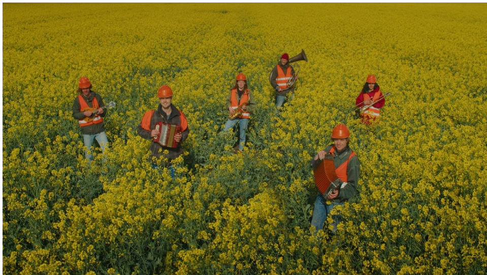
still Kon Minder

Kon Minder is een romantische, komische, kleurrijke, muzikale hybride korte film (zowel docu als fictiefilm) over de schoonheid van het dagelijkse leven van Groningers in Groningen. Portretten als schilderijtjes laten het verloop van een doodgewone vrijdag zien. In deze film zit geen drama. Dat is namelijk helemaal niet Gronings. Alles gaat gewoon zoals het gaat. En dat alles is prachtig, rustgevend en prima zoals het is. Zoals een echte Grunneger zou zeggen: 'Kon minder'.