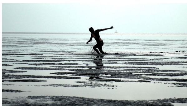
still As de Fisken