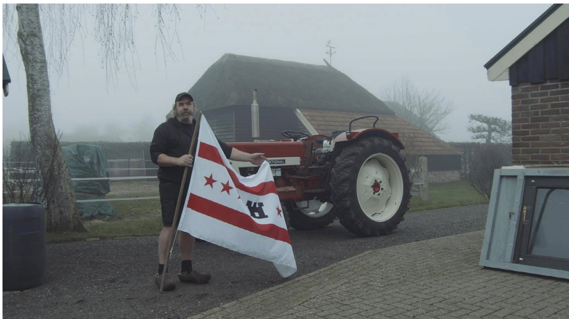
still De Vlaggenhijzers