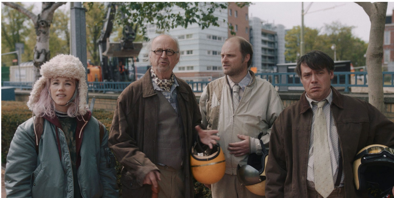
still Vaders en Zonen