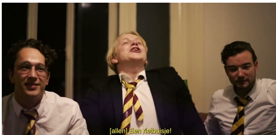
still De buurvrouw is een kutwif

In deze energieke, ongepolijste documentaire over jongenscultuur volgt debuterend regisseur Lilian Anneloes een jaar lang een omvangrijke vriendengroep van doodnormale witte, hetero, cisgender studenten. Via haar eigen blik, als feministische kunstenaar, zoekt zij in De Buurvrouw is een Kutwif naar het grijze gebied in het privilegedebat. Welke stereotypen over witte, hetero jongemannen zijn waar? En welke zijn niet waar? Wat weten de jongens over hun eigen, alledaagse privileges? En hoe praat je nou eigenlijk over je emoties en problemen, wanneer je tegelijkertijd wilt voldoen aan de fermheid die van je wordt verwacht in een toxische mannencultuur? Aan het woord komen verschillende experts, waaronder Emancipator-oprichter Jens van Tricht, maar Lilian Anneloes laat vooral het woord - en beeld - aan de jongens zelf.