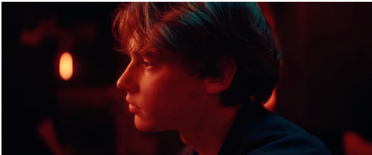
still Fire Tonight

Een hartverscheurend drama over Ila, een dakloze jonge vrouw die verstrikt is geraakt in een verwoestende verslaving en haar innerlijke demonen en een verstikkende schuldental van een drugsdealer moet overwinnen in het meedogenloze straatleven van Amsterdam.